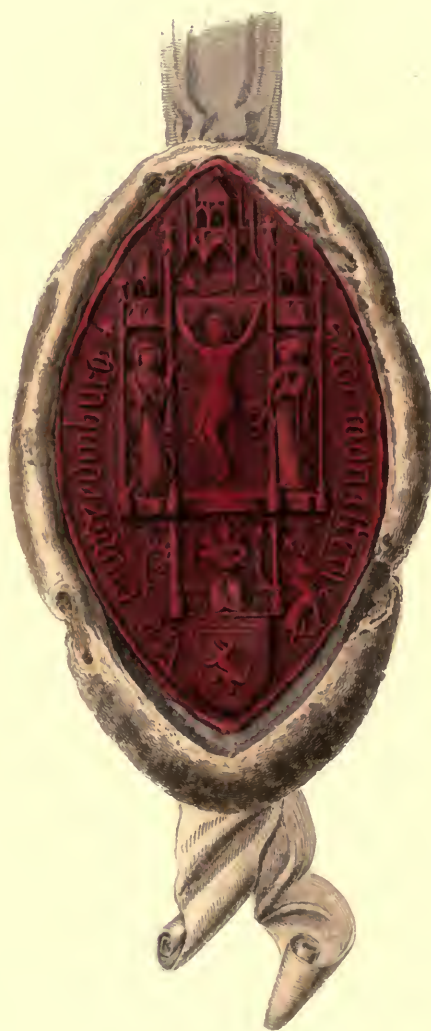
SIGILLUM COMMUNE Monasterii Sancte Crucis DE EDINBURG.

In nomine dñi nr̄i ihu xp̄i. & in honore sc̄e crucis. & ep̄oz regni mei. Conntum quoq; baronumq; concedo ecclie sc̄e crucis edwines-burgensi.